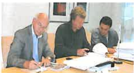
Tilbudsåpning hos Statens vegvesen på del første delprosjektet i Fosenevegene.