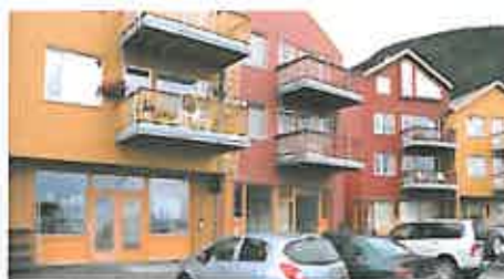
Prosjektkontoret i Vanvikan