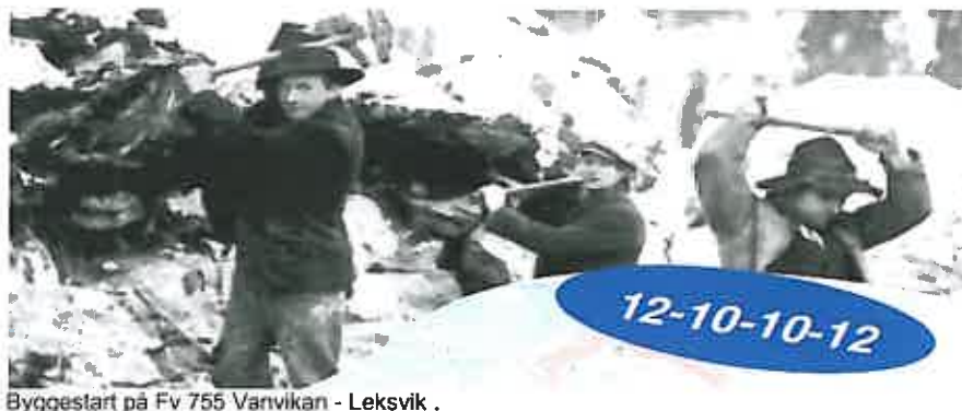
Byggestart på Fv 755 Varvikan - Leksvik .